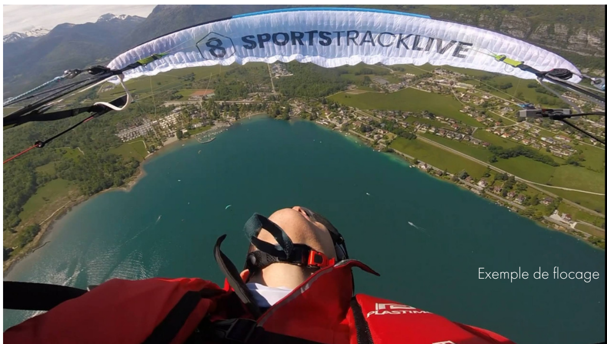
Exemple de flochage